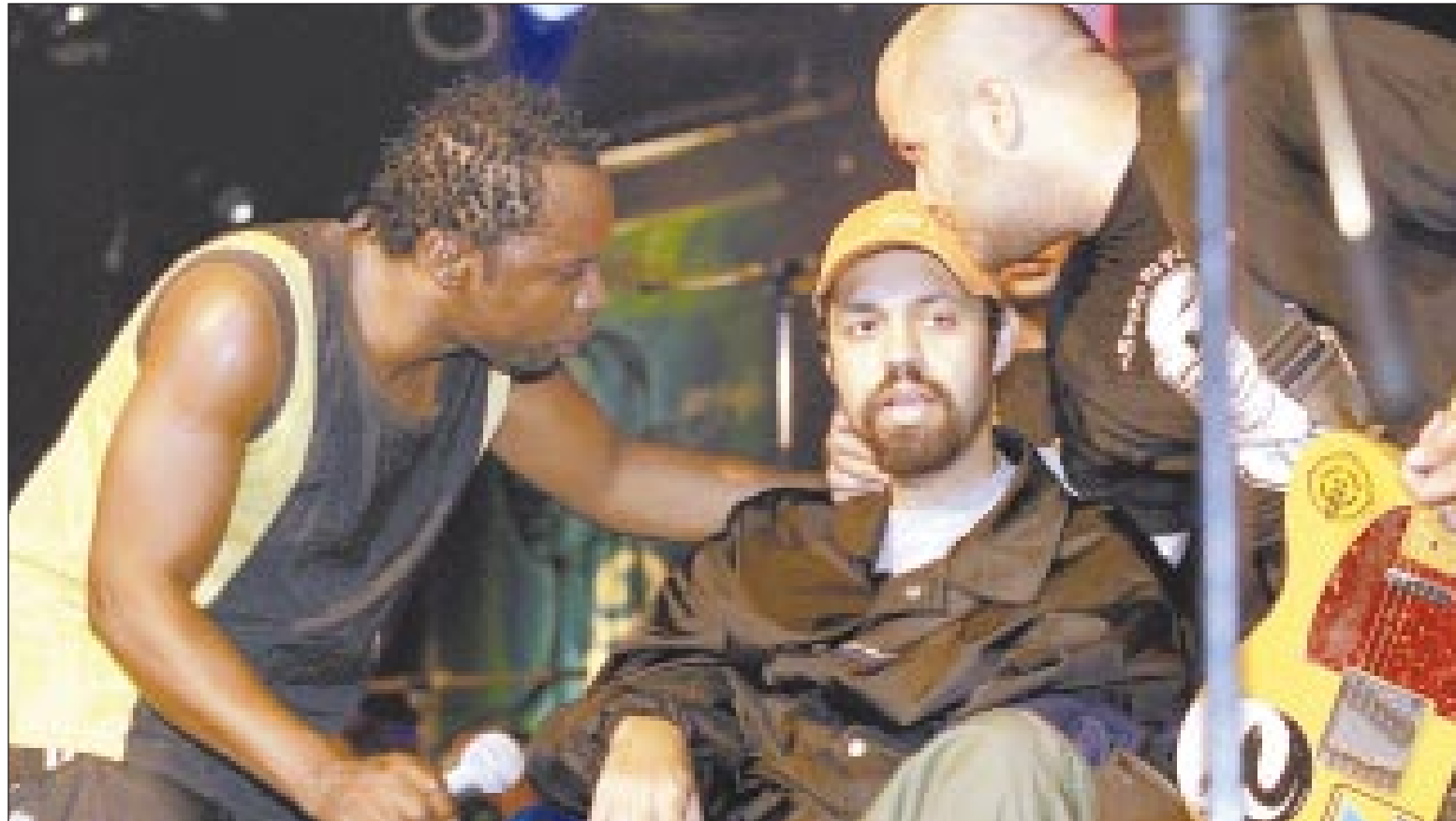
O CD duplo e ao vivo do Rappa, gravado no ano passado no bar Opinião, em Porto Alegre, deverá ser lançado ainda no mês de julho

Yuka – É impressionante. Acho que o acaso de estar falando as coisas que falava, e aconte-